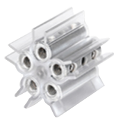
connettore non incluso not included connector